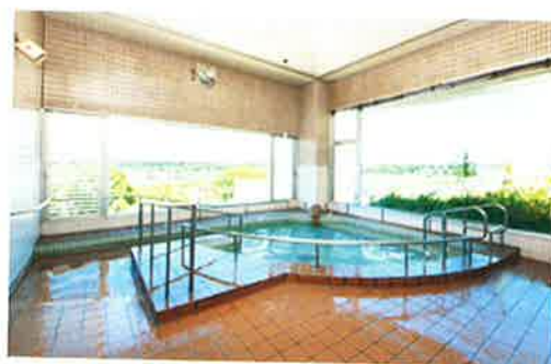
展望風呂（源泉掛け流し）