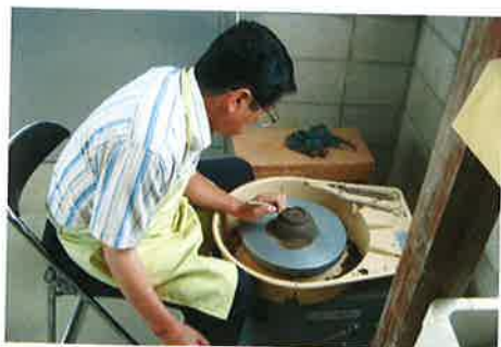
陶芸教室の常連、障害（右麻痺）がないと分からない工夫を凝らした作品を次々と生み出されています。

当センターでは通所を利用される方を対象に夕食のお持ち帰り弁当（まんてん弁当）の提供を行い、在宅での生活を支えるお手伝いを行っています。また、4階アトリエではリハビリの一環として陶芸教室を行い、皆さん楽しく「世界にひとつ」の陶器を制作されています。その他にも、4階にある展望風呂で、山鹿の風景を眺めながら天然温泉に入浴し、心も体もリラックスしていただいております。