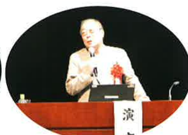
小山先生のご講演