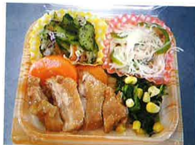
まんてん弁当の調理例